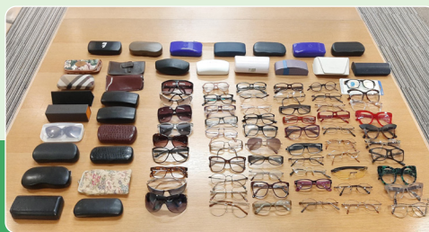
Lunettes usagées récoltées à notre siège social, dans le New Jersey.

L'équipe verte a aussi continué d'encourager les associés à réutiliser plutôt qu'à jeter. En plus de notre collecte de manteaux d'hiver organisée chaque année à notre siège social, dans le New Jersey, nous avons mis sur pied une collecte de lunettes usagées. Cette initiative nous a permis de récolter pas moins de 118 paires de lunettes, qui ont été données au Club Lions de Rutherford. Les verres ainsi récupérés se voient donner une nouvelle vie en aidant des personnes qui ont des problèmes de vue aux quatre coins du monde. Le secrétaire du Club Lions de Rutherford est venu nous rendre visite en personne pour récupérer les lunettes et remercier Kumon de sa contribution.