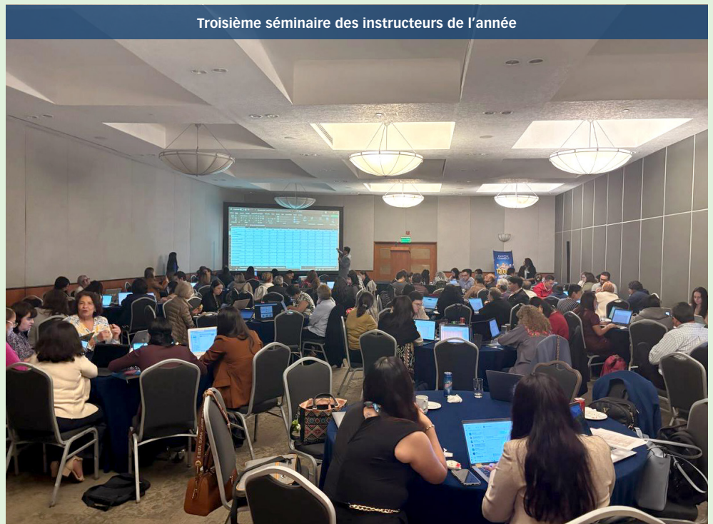
Troisième séminaire des instructeurs de l'année

1 488 feuilles de papier et de 496 chemises, dont la production aurait nécessité 148,8 litres d'eau et 7,4 kg de bois, ce qui équivaut à un jeune arbre. Cet effort a en outre évité l'émission de quelque 13,4 kg de CO 2 , ce qui correspond aux émissions produites par une voiture roulant 90 km.