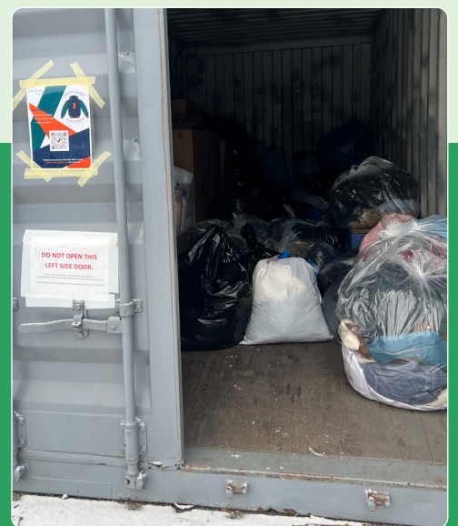
Entregando las donaciones de abrigos de KNA en el sitio de recolección de Jersey Cares.

Los 19 abrigos que recolectamos en invierno fueron donados a la colecta de abrigos más grande organizada por Jersey Cares . Estos abrigos de invierno se distribuyen a hombres, mujeres, niños y bebés necesitados en todo Nueva Jersey.