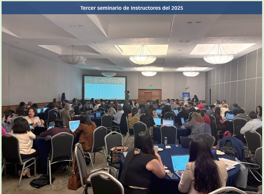
Tercer seminario de Instructores del 2025

Para ponerlo en perspectiva, producir esa cantidad de papel habría requerido 148.8 litros de agua y 7.4 kg de madera, lo que equivale a un árbol joven. Además, este esfuerzo redujo la emisión de aproximadamente 13.4 kg de CO 2 , lo que equivale a las emisiones producidas por un coche mediano al recorrer 90 kilómetros.